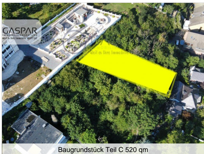
Baugrundstück Teil C 520 qm