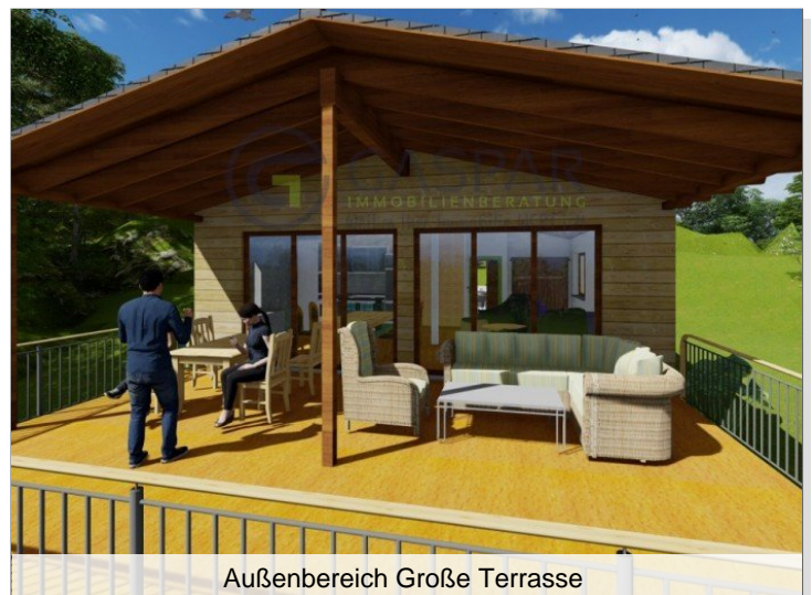
Außenbereich Große Terrasse